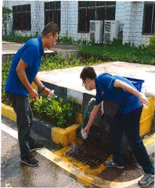
图 1：西江水源采样点采样口