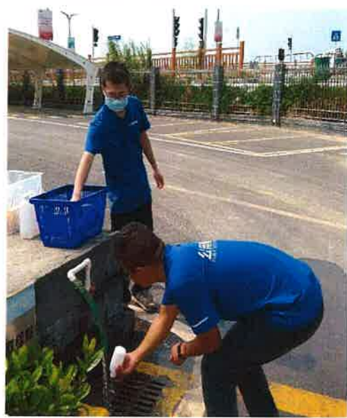
图 2：西江水源采样点采样口