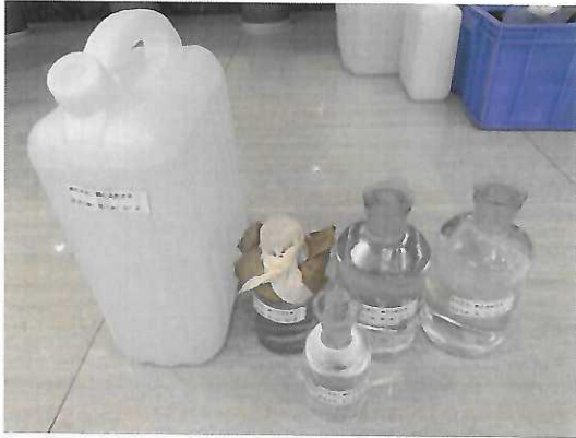
鹤山北控水务第三水厂出厂水样品