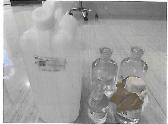
鹤山北控水务第三水厂出厂水样品