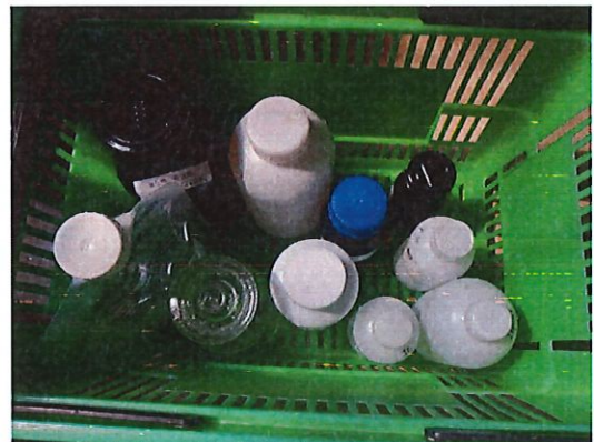
共和镇北控水务鹤共营业所 (鹤山市共建路凤凰城) 水样