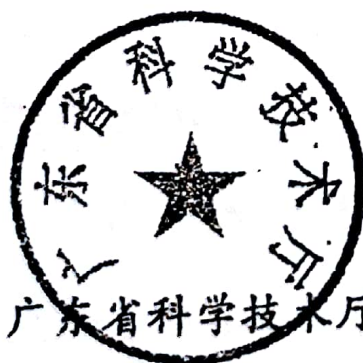
广东省科学技术厅