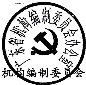
广东省机构编制委员会办公室