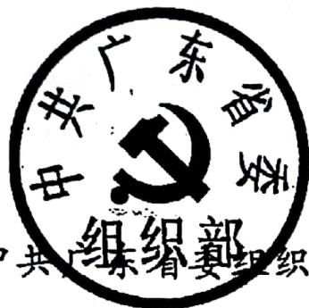
中共广东省委组织部

经省委、省政府领导同意，现将《关于加快新时代博士和博士后人才创新发展的若干意见》印发给你们，请结合实际认真抓好贯彻落实。