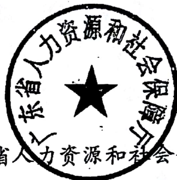
广东省人力资源和社会保障厅