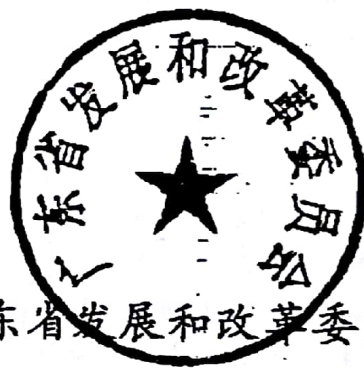
广东省发展和改革委员会